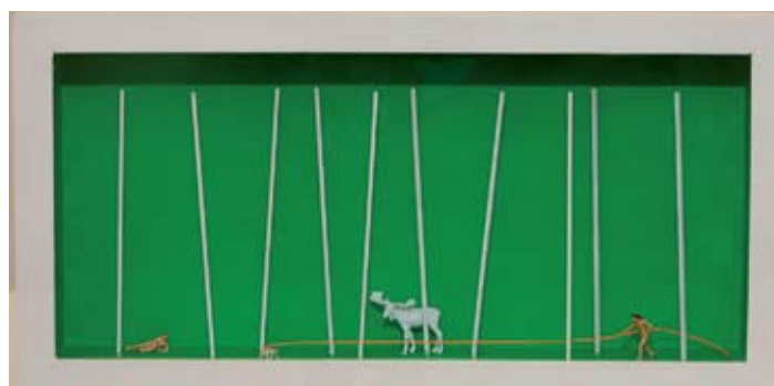
Att spåra med hund.